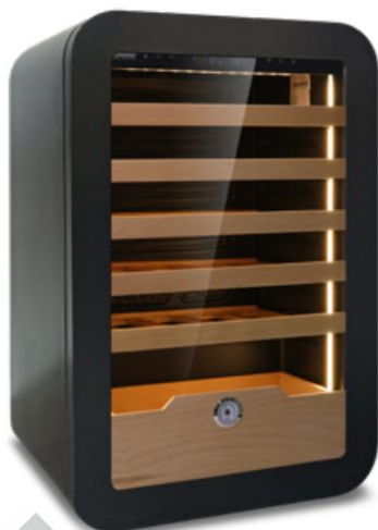
VINARIUS 40 BLK