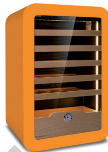
VINARIUS 40 ORN