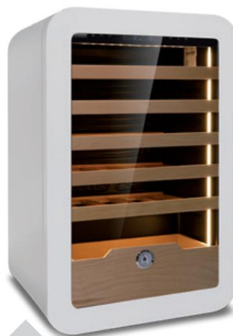
VINARIUS 40 WHT