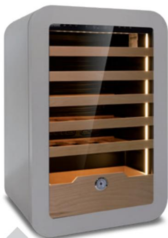
VINARY 40 ŠEDÁ