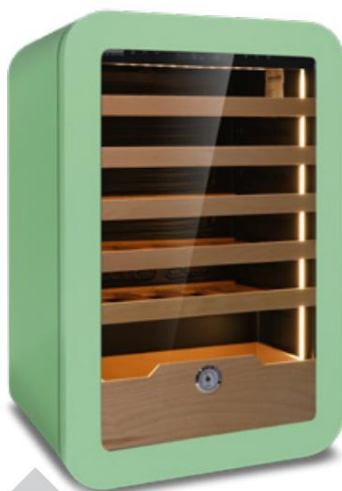
VINARIUS 40 GRN