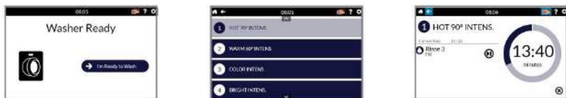
XControl FLEX PLUS přístup, program, a cyklus obrazovky

Kombajn s Trace-Tech™ a i-Trace prádelna software pro správu pro dokonalé ovládání z vaší prádelna instalaci